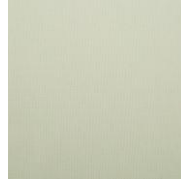
Arenal Gris Claro