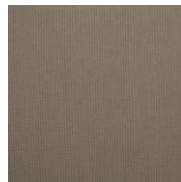
Arenal Gris Oscuro